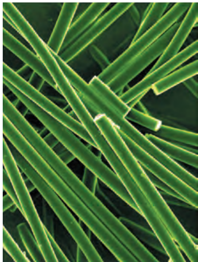
Microfotografía de fibras de nano tiss

Ahora bien, si el chip con el código es incorporado a un envase de alimentos, y al resto de los artículos que se comercializan en un supermercado (de limpieza, bazar, perfumería, vestimenta, etc.), y el local instala antenas de radiofrecuencia en determinados puntos, todo lo que deberá hacer el cliente es llenar su carrito con lo que decida y pasar por el sector indicado. Un lector electrónico detectará instantáneamente el código de cada