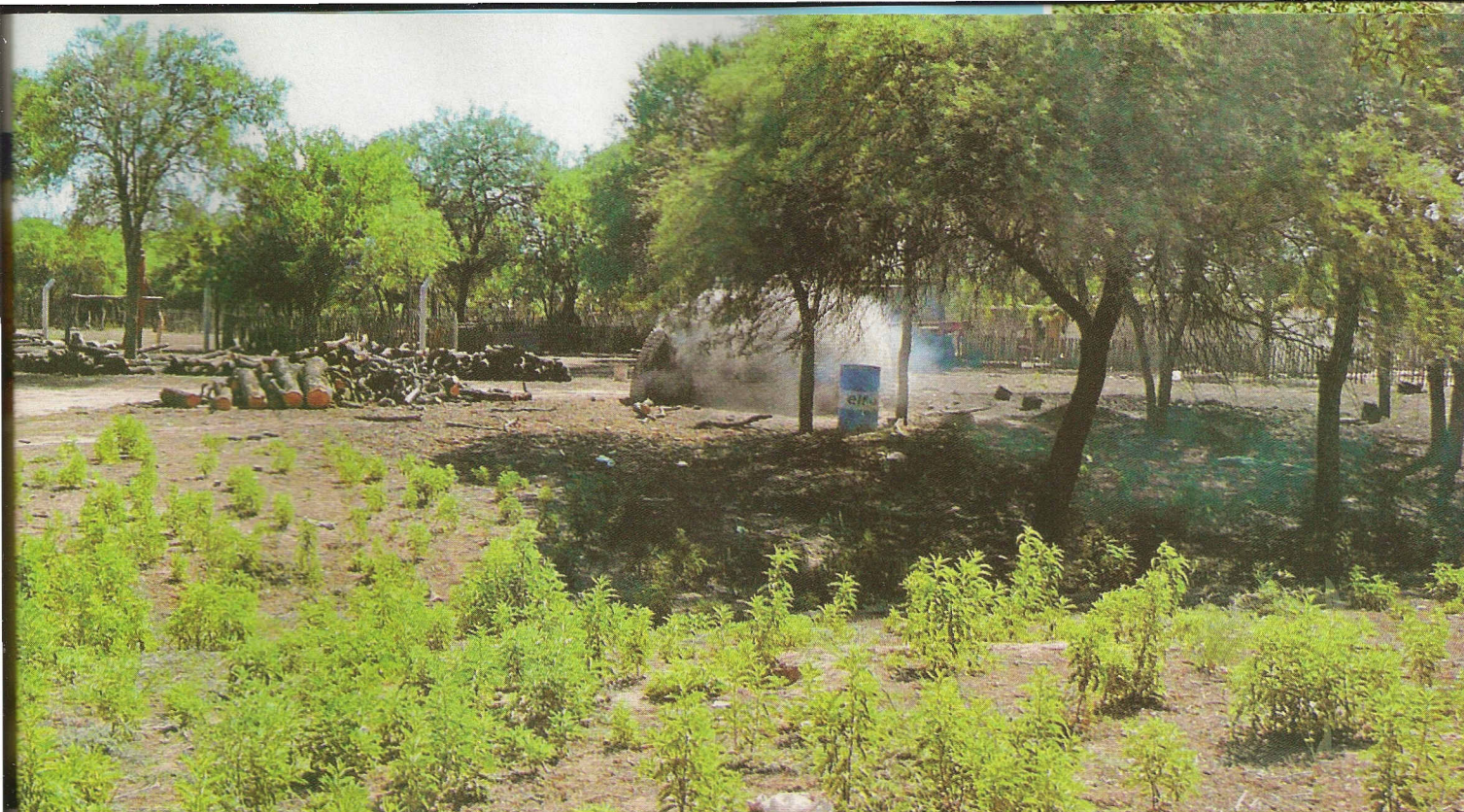
Vista de los exteriores de una vivienda de los "guardianes del bosque". En toda la zona es común ver funcionando los hornos para hacer carbón vegetal, una de las actividades que más creció en los últimos tiempos al ritmo en que aumentaba la deforestación de los montes.

se hará con otra certificación que le adicionará valor, ya que será a través del Fair Trade, o comercio justo. El precio a conseguir será entre 30 y 40 % superior al de la miel convencional.